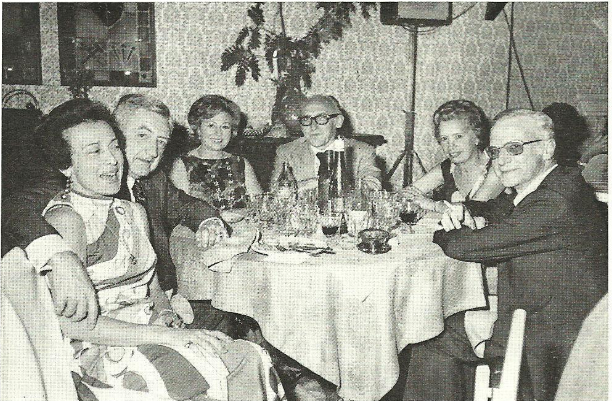
Sres. de Bargañó, Sres. de Fabregat, Sres. de Sargatal