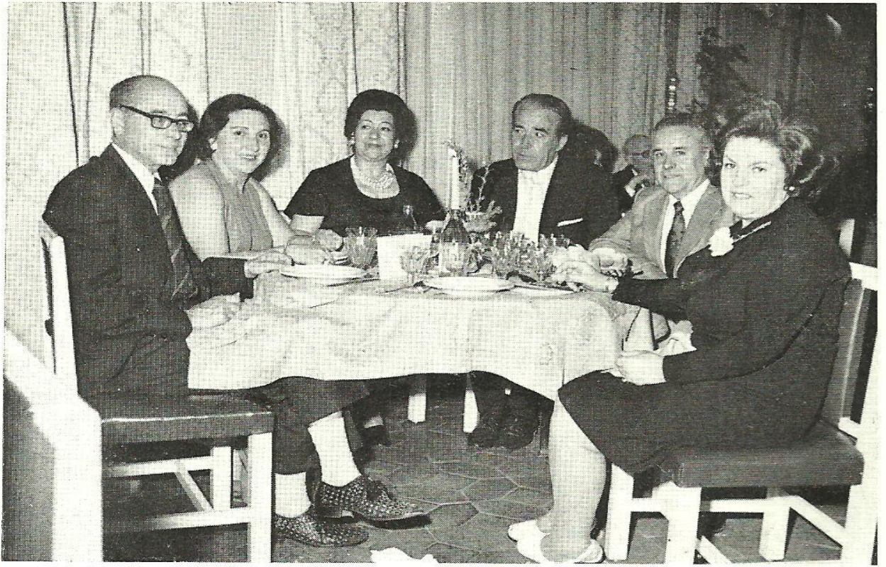
Sres. de Grande, Sres. de Castilla, Sres. de Sáez