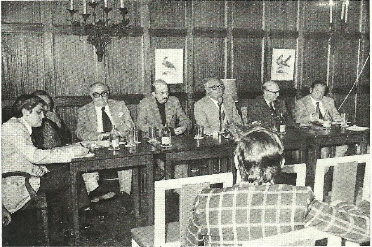
Mesa Presidencial de la XXI Asamblea General de FYVAR