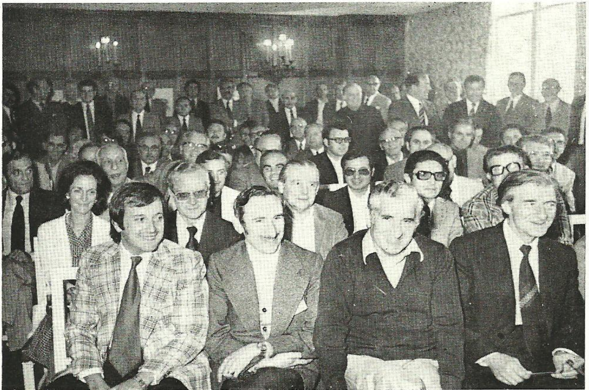
Uno de los aspectos de la Asamblea