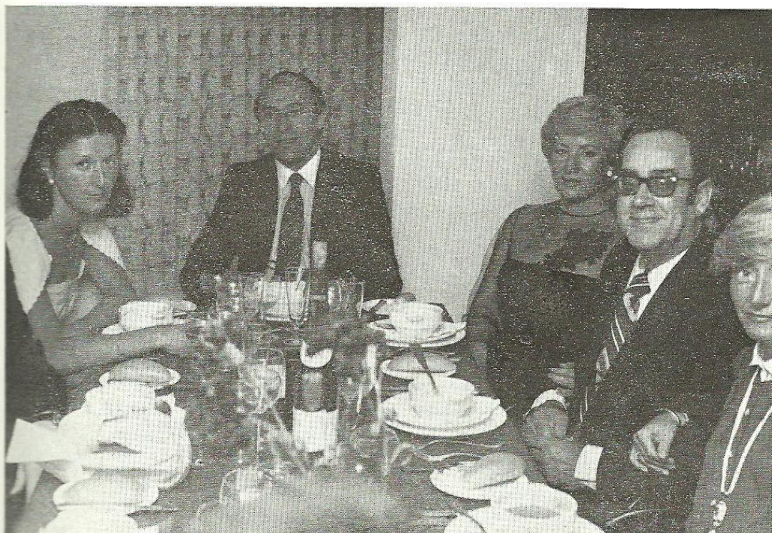
Sres. de Grañeda, Sres. de Burón, Sra. de Biel