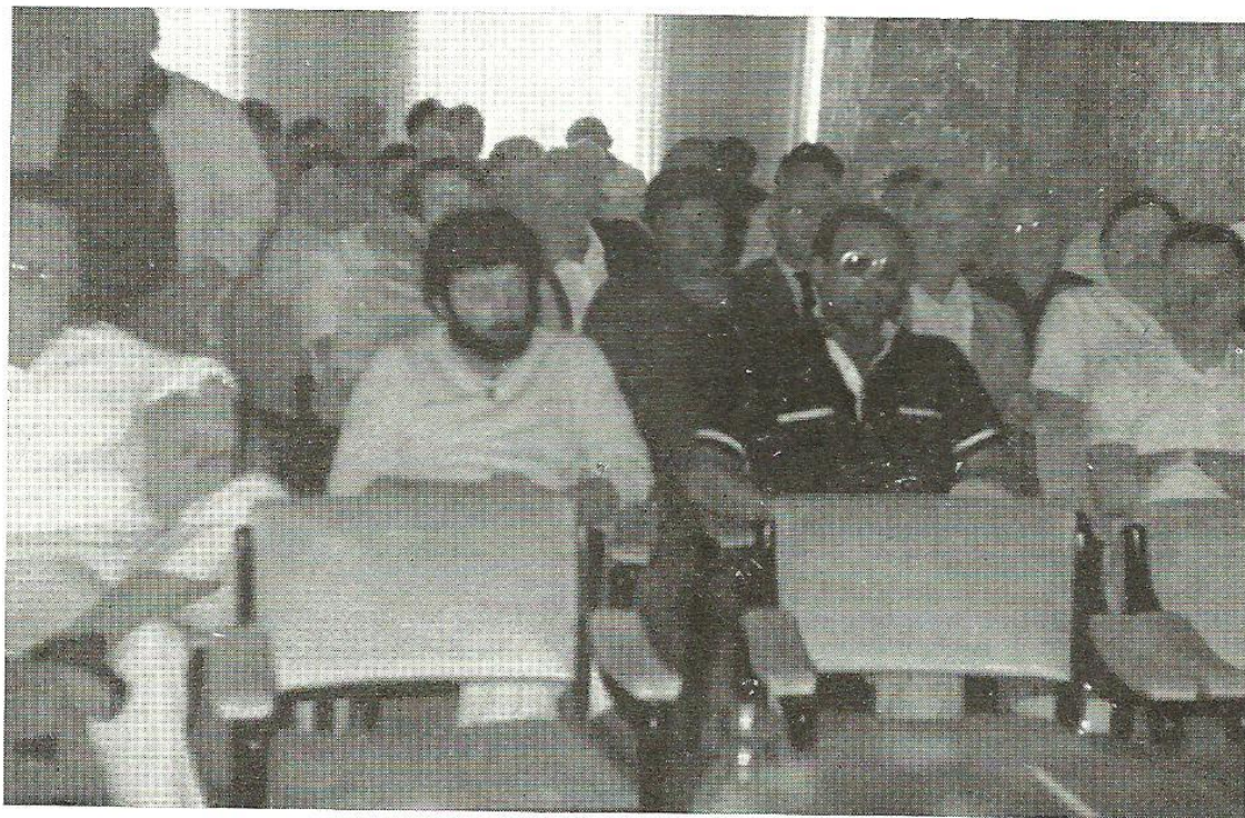
Un aspecto de la Asamblea, durante los debates

6.º Refiriéndose a la Asamblea Extraordinaria celebrada el 25 de noviembre de 1980 en el Hotel Balmoral de Barcelona y con respecto al Artículo 10 del Reglamento de Régimen Interior, a su derogación y nuevo redactado, se interpreta que el Apartado B, entiende que la venta a empresas que no sean de F.Y.V.A.R., está condicionada a que las mismas tributen con Número de Identificación Fiscal vigente, como empresa dedicada a publicidad y reclamó, y por lo tanto el mentado Apartado B debería quedar redactado de la forma siguiente: «Apartado B. A vender estrictamente a empresas con Número de Identificación Fiscal conocido vigente y que tribute como empresa dedicada al ramo de la publicidad y reclamo».