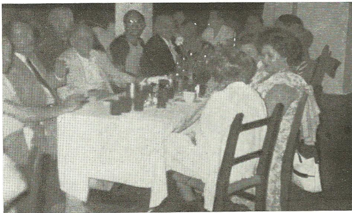
Las fotos muestran a los Asambleístas durante la excursión y en el almuerzo típico celebrado en Santa Eulalia

A media tarde, se emprende felizmente el viaje de regreso hacia el Hotel, dando con ello fin a esta simpática jornada.