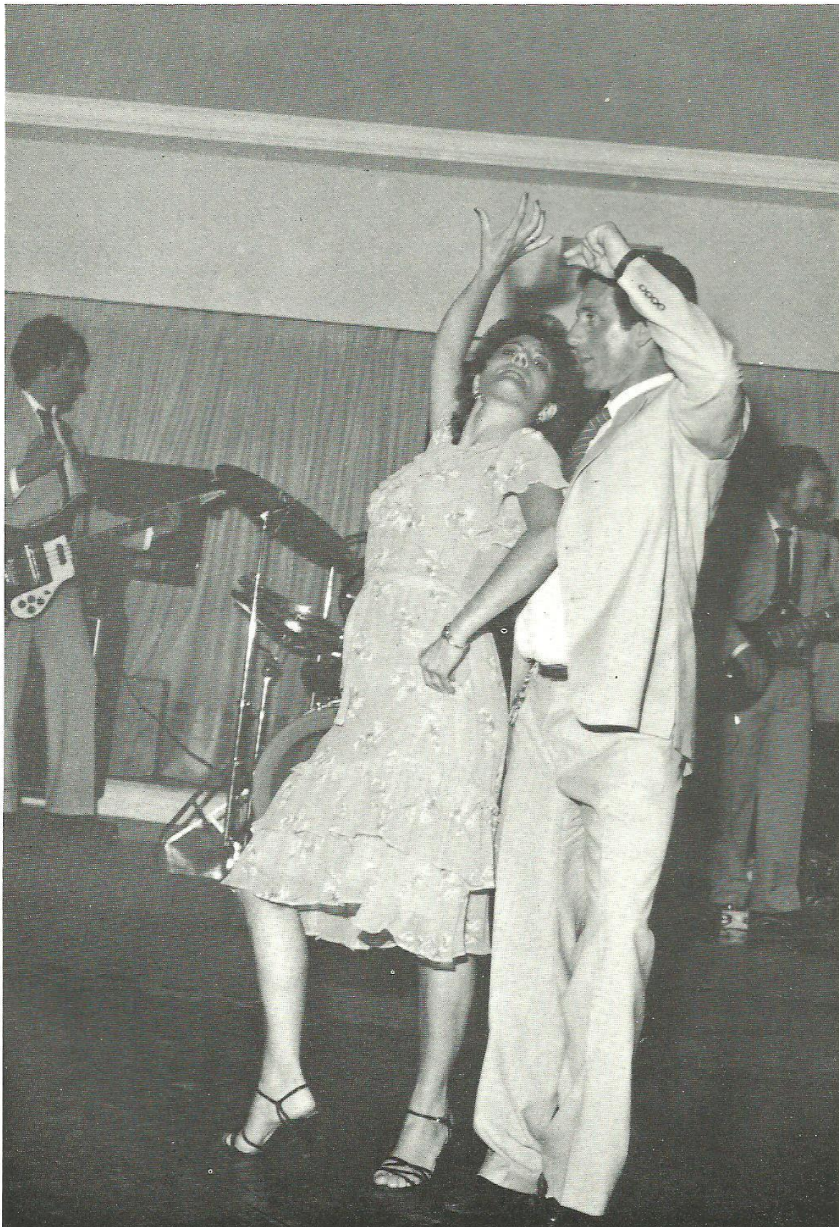
El matrimonio Mesa, en una espontánea exhibición de "Sevillanas"