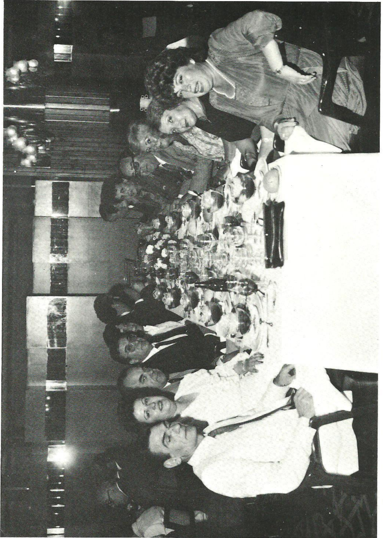
Sres. de Chorro, Sres. de Molina, Sres. de Zamora, Sres. de Burón, Sres. de Aguado, Sres. de Pérez, Sres. de Rodríguez