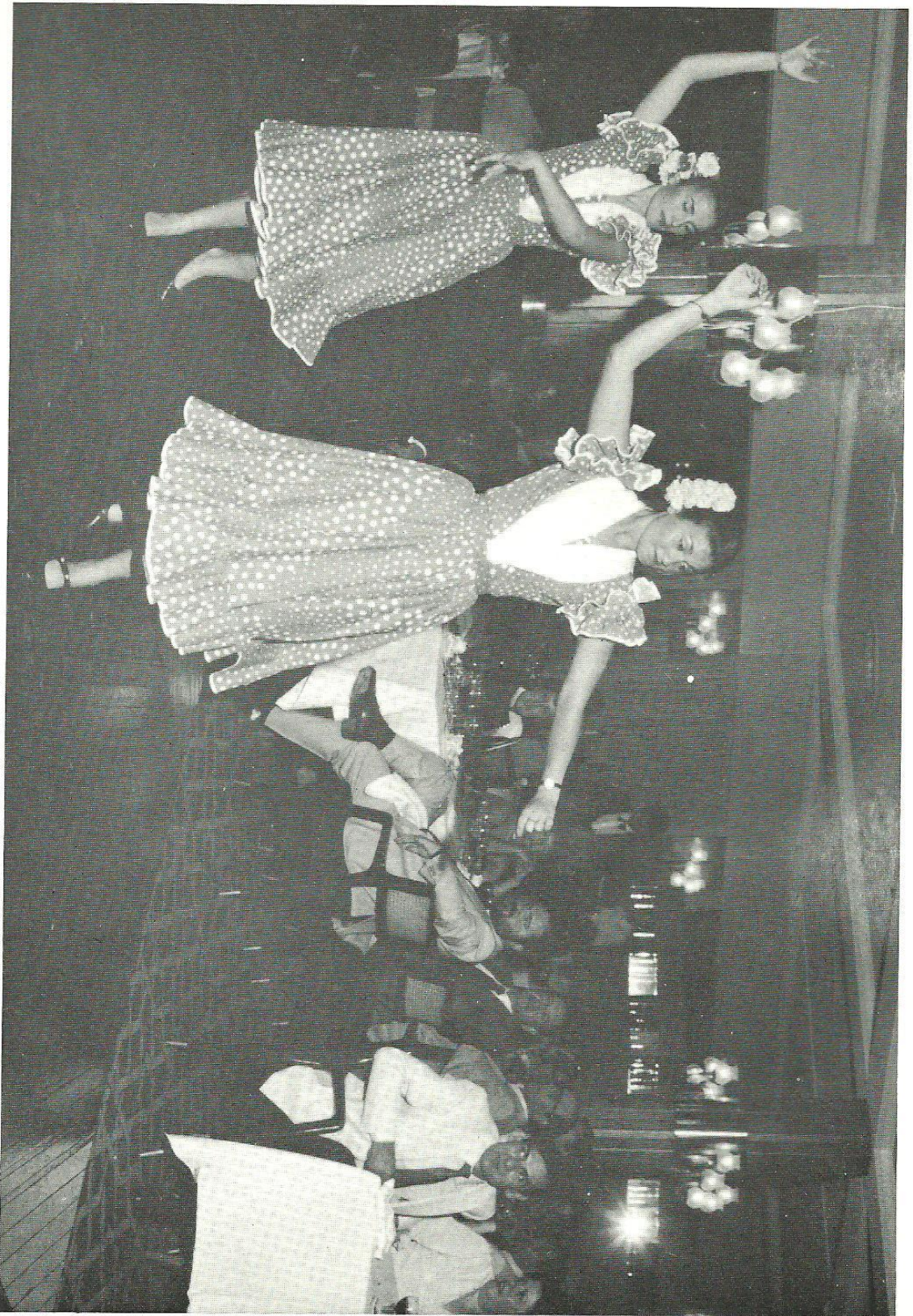
Duo folklórico, que nos deleitó con sus danzas y bailes típicos.