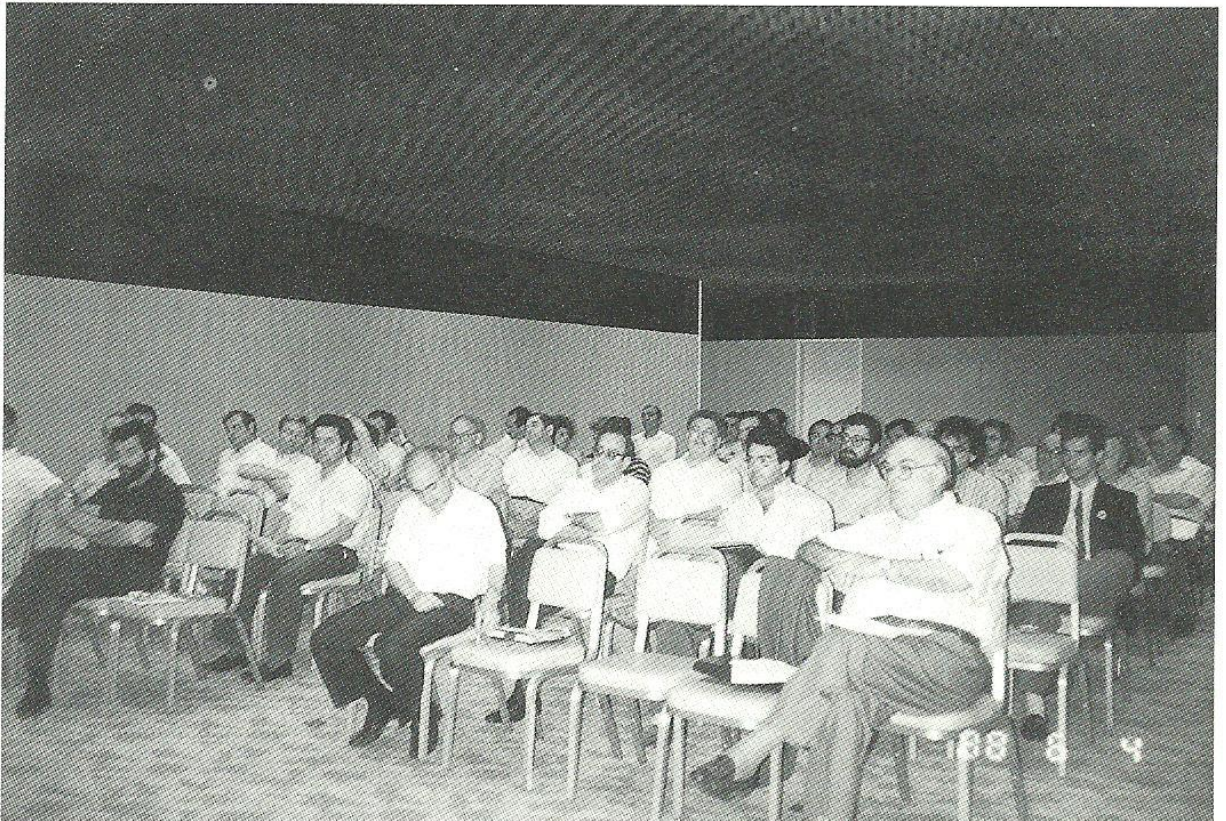
Asistentes a la Asamblea